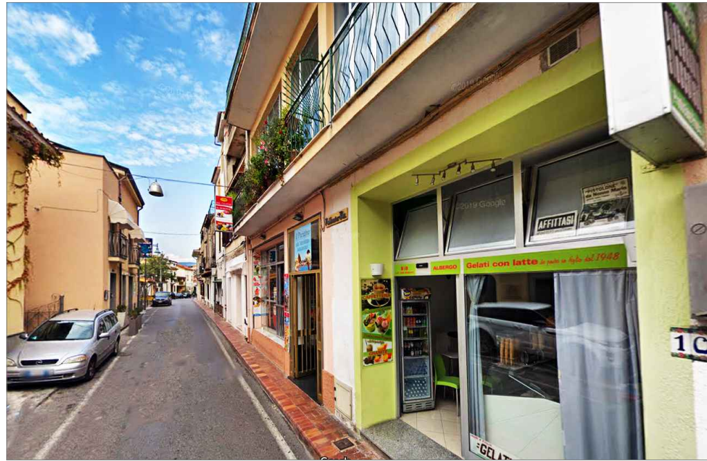
Punto di vista n. 1 attenzione esposizione promozionali