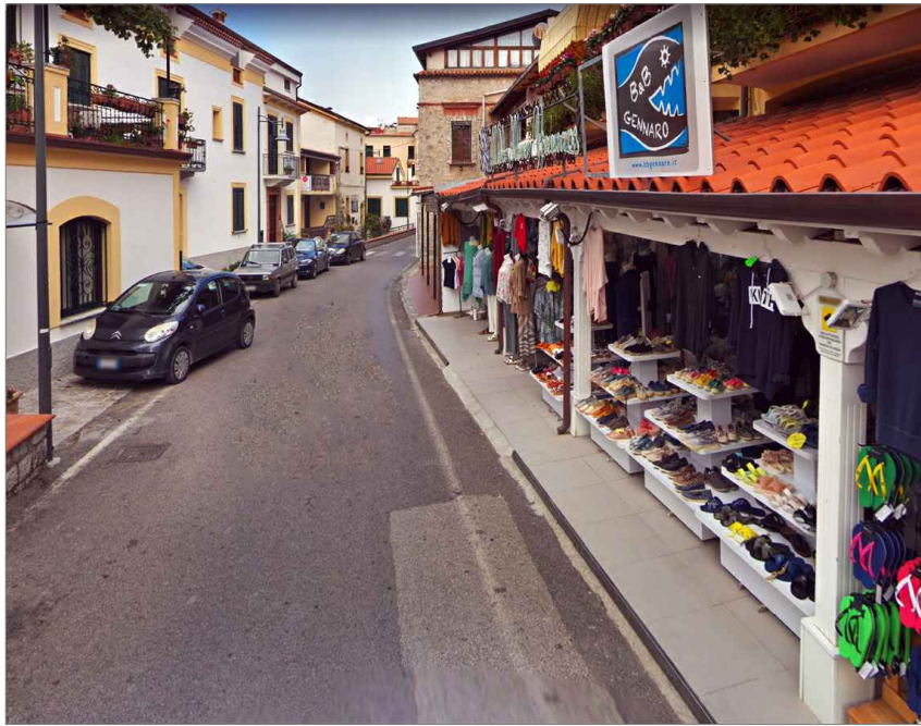
Punto di vista n. 5 ripristino pavimentazione