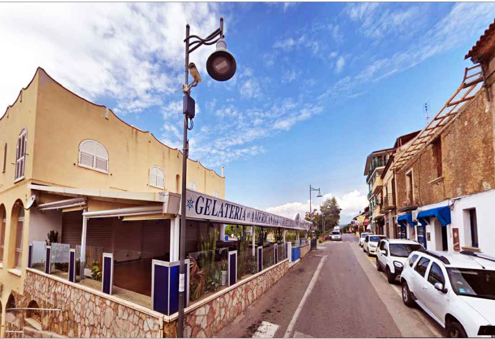
Punto di vista n. 8 attenersi a disposizioni RUEC