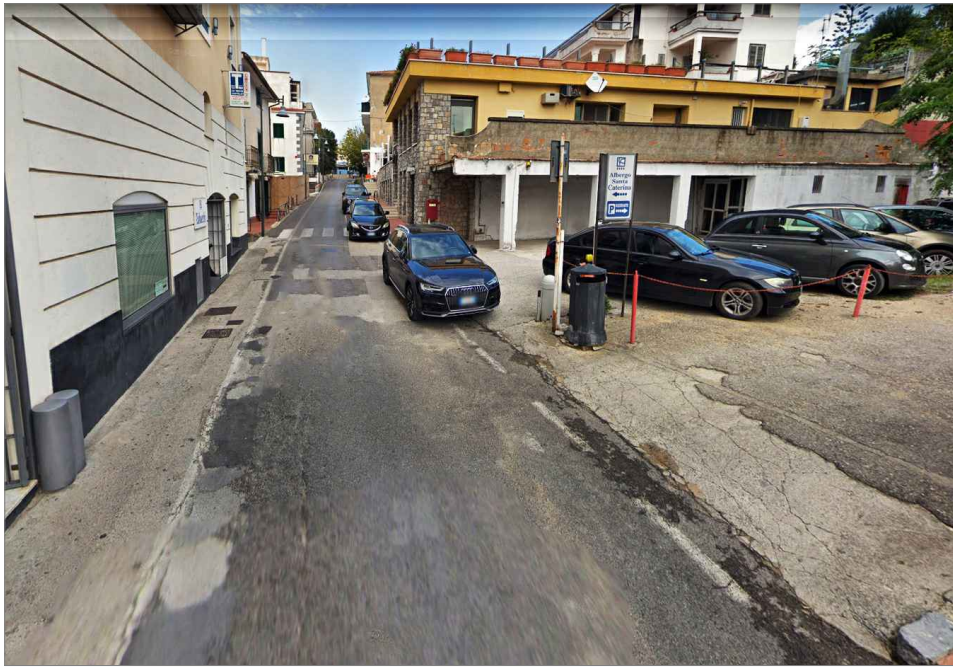
Punto di vista n. 6 ripristino pavimentazione e aree di sosta