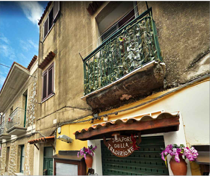
Punto di vista n. 2 ripristino facciata