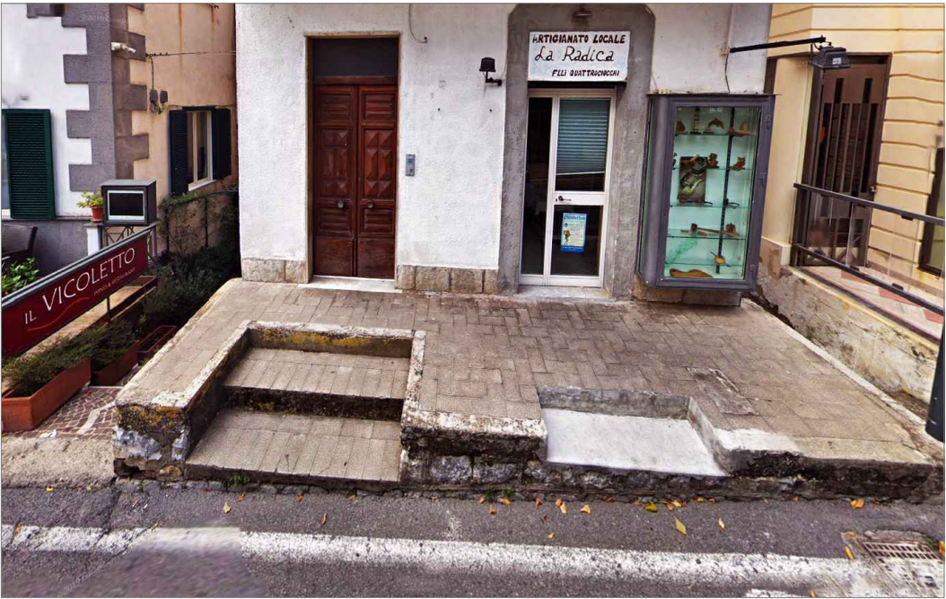
Punto di vista n. 7 ripristino spazi antistanti