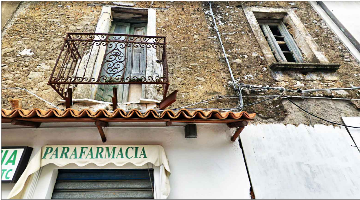
Punto di vista n. 4 ripristino e/o schermatura facciata