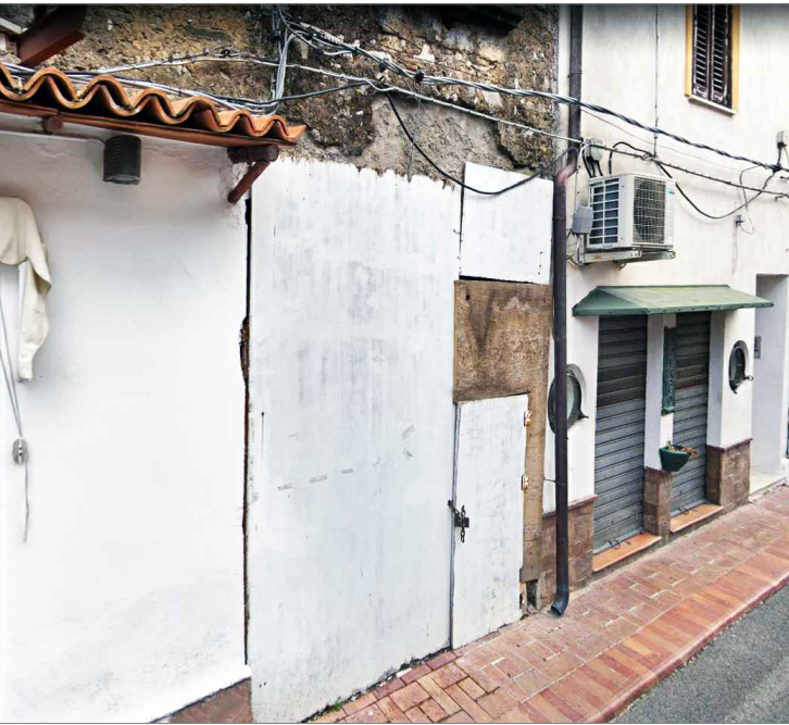
Punto di vista n. 3 ripristino facciata